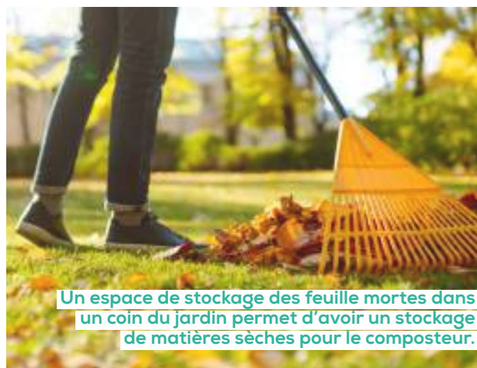
Un espace de stockage des feuilles mortes dans un coin du jardin permet d'avoir un stockage de matières sèches pour le composteur.