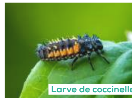
Larve de coccinelle